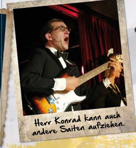
Herr Konrad kann auch andere Saiten aufziehen.