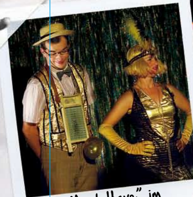
"Must Have" im Showbusiness: Der Waschbrettbauch!